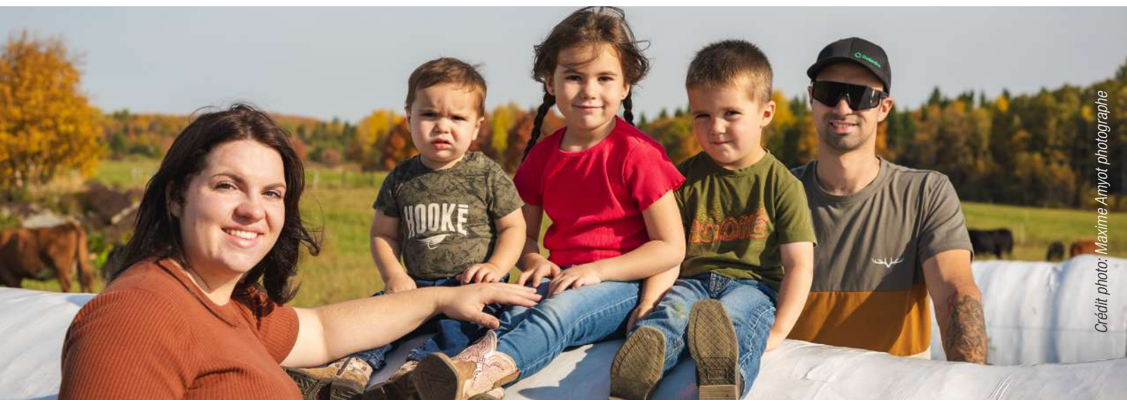
Table bioalimentaire du Bas-Saint-Laurent SADC de La Mitis Mitis en affaires MAPAQ Syndicat de l'UPA de La Mitis

Directeur général Directrice générale Agronome, Direction régionale du Bas-Saint-Laurent Président